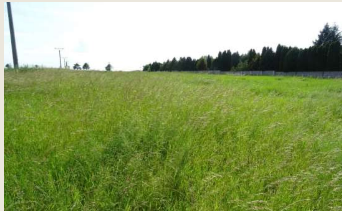
Plocha vedľa existujúceho cintorína