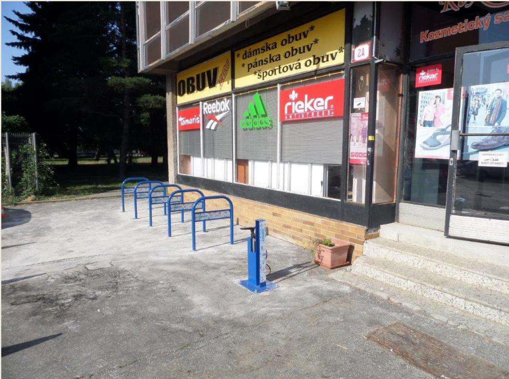
Na Duklianskej ulici v Zlatých Moravciach