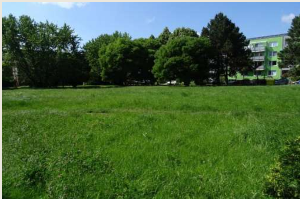
Plocha v rámci sídliska